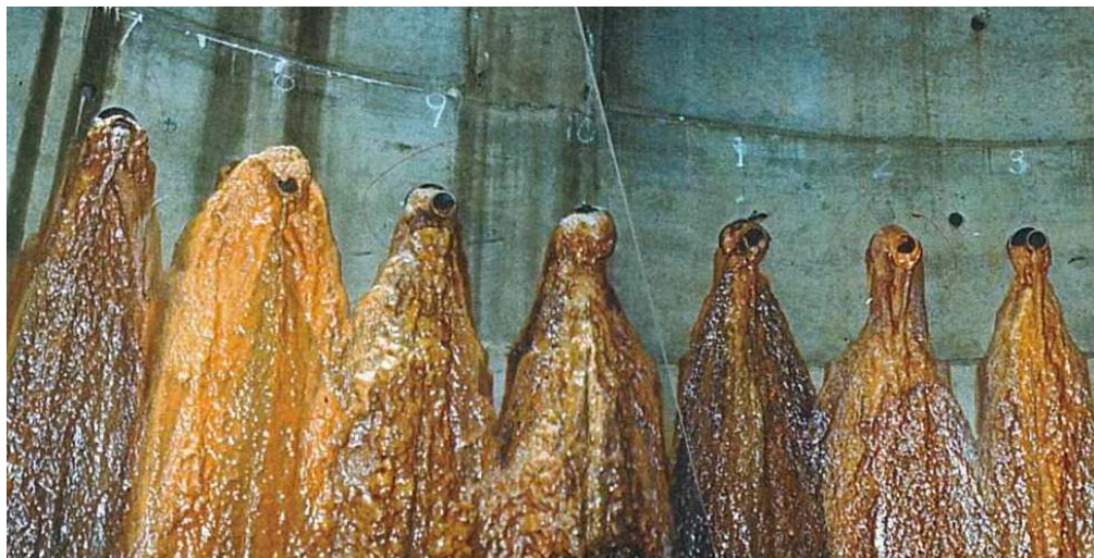
《水抜きボーリング孔の機能低下状況》 地下水の流動に伴う粘土の流入や鉄バクテリアの発生による目詰まりの発生

孔内洗浄では機能が回復しない場合、目詰まりしにくい水抜きボーリング孔の提案を行います