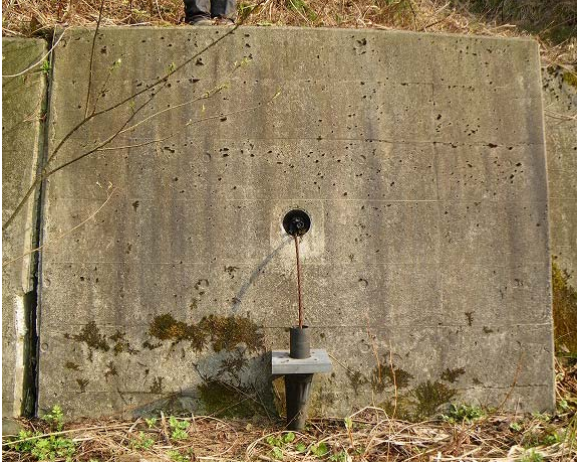
《アンカー破損状況》 アンカー定着力の低下による破損