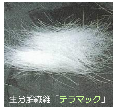
生分解繊維「 テラマック 」