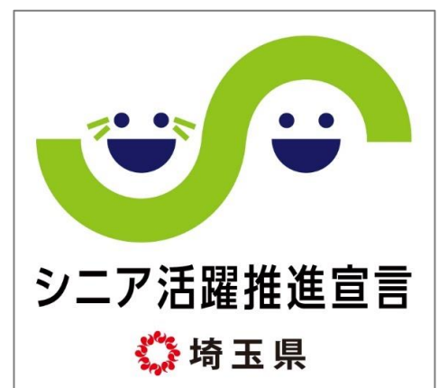
埼玉県シニア活躍推進宣言企業シンボルマーク