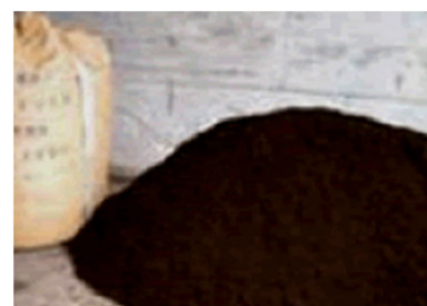
バイテクソイル (牛糞発酵分解 約7ヶ月後経過)