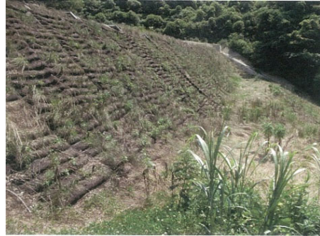
バイオ・植生注入マット工法によるモルタル法面の緑化