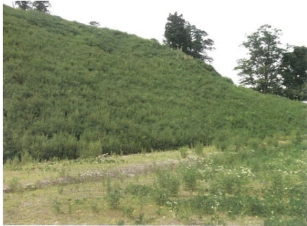
バイオプラスターチ吹付工法による緑化