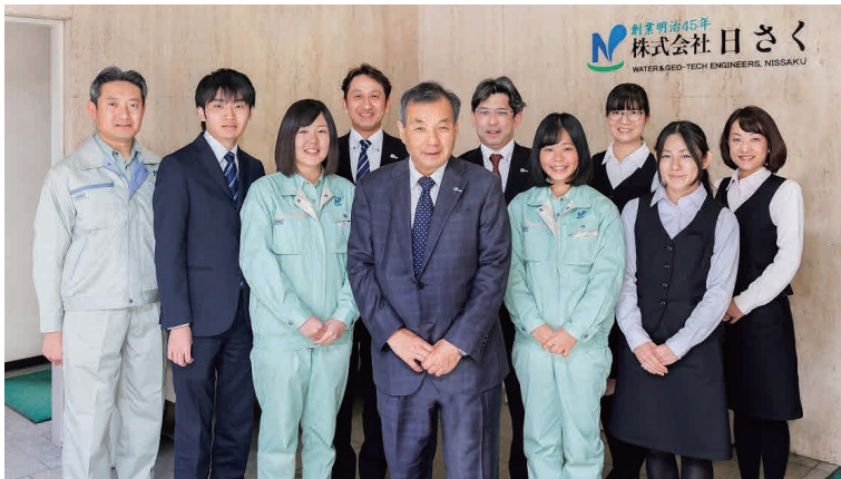
時代とともに井戸を掘り続け 日さくは創業150年、200年の未来へ向かいます

株式会社日さくは、1912年(明治45年)に創業し、井戸掘さくや地下への強い思いを持ち続ける「百年企業」です。