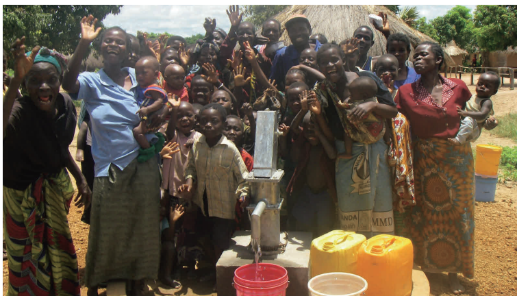
新しい水汲み場(ハンドポンプ付井戸)に集まる村人(ザンビア・2013年)